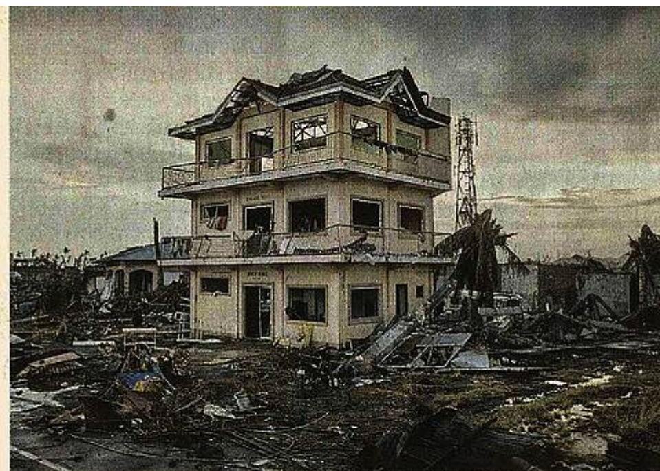
Traurige Überreste: Der Gewalt des Supertaifuns widerstanden selbst Steinhäuser nicht ohne Verwüstungen.

Bei Erdbeben vergrößern sich in den letzten Jahrzehnten die Opferzahlen. Beweist dies, dass die Erdbeben grundsätzlich stärker werden ? Nein! Sondern das Schadenspotential ist gestiegen, denn es leben immer mehr Menschen, und in manchen Regionen wohnen sie zumeist in weniger stabilen Häusern! Das folgende Bild aus der NW vom 13.11.2013 demonstriert die Konsequenzen der Leichtbauweise sehr drastisch. Das dreistöckige Haus ist beschädigt, aber es steht noch und kann repariert werden. Die in Leichtbauweise errichteten Häuser wurden zertrümmert.