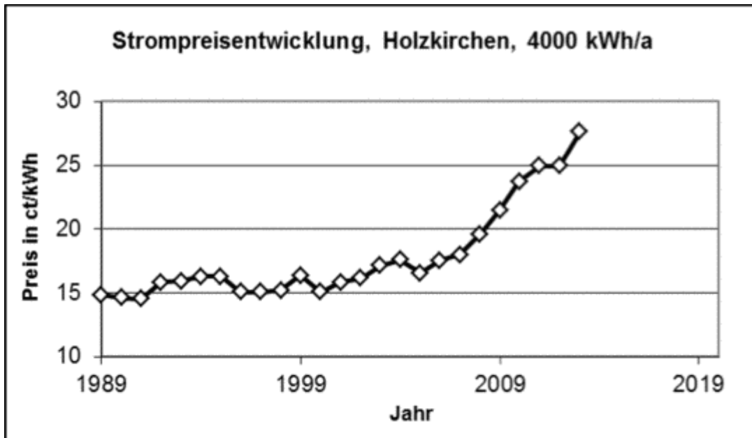
Abb. 1: Strompreisentwicklung in Holzkirchen

Deutschland ist ein rohstoffarmes Land, die fossilen Energien müssen bis auf Braunkohle eingeführt werden. Auch die Förderung von Steinkohle soll in Deutschland zu Ende gehen, wie unter Rüttgers in NRW beschlossen wurde.