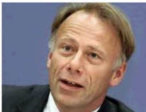
Trittin macht erneuerbare Energien als Sündenbock bei Stromversorgern aus.

Bundesumweltminister Jürgen Trittin hat die Energieversorger wegen wiederholter Erhöhungen der Strompreise scharf angegriffen. "Wenn einzelne Stromkonzerne zum wiederholten Mal ihre Strompreiserhöhungen auf die Förderung der erneuerbaren Energien schieben, dann ist das reine Abzockerei", sagte Trittin der "Bild am Sonntag". "Tatsache ist, dass im letzten Jahr nicht mehr erneuerbarer Strom eingespeist wurde als 2002".