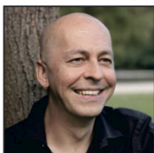
Oliver Janich Bundesvorsitzender der Partei der Vernunft