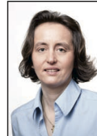
Beatrix von Storch Vorsitzende des Vereins Zivile Koalition e.V.