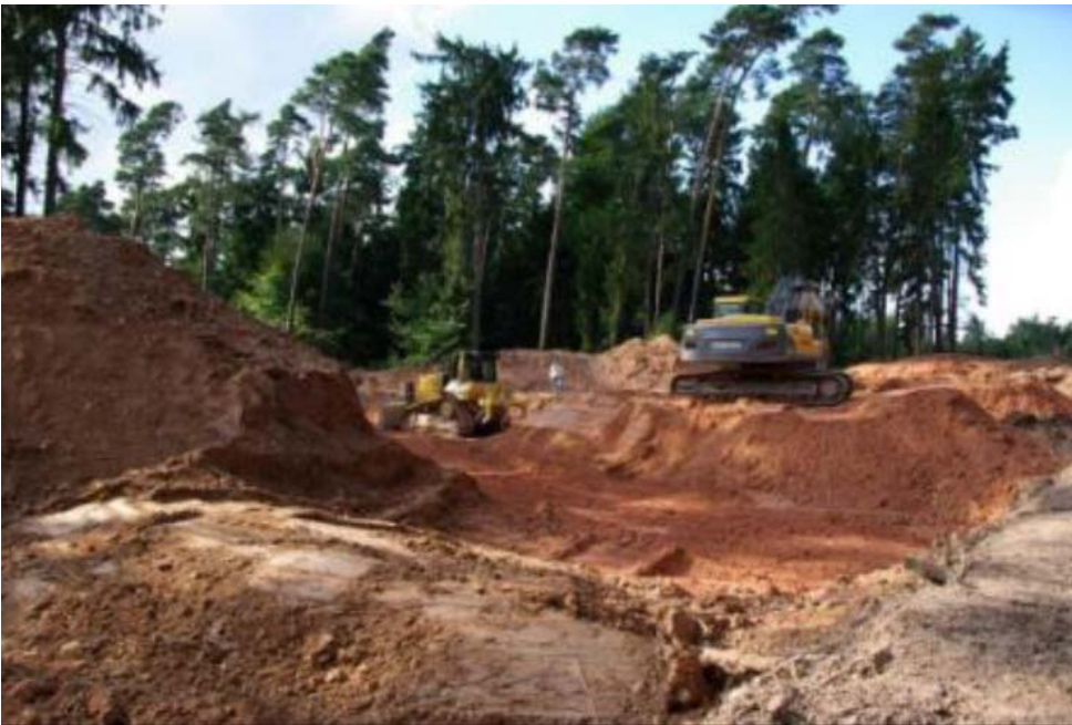
Bild 12: Für jedes Windrad werden 10.000 m 2 Wald zerstört und das Umfeld dauerhaft biologisch entwertet

Auch der Schutz unserer Kulturlandschaft gehört zum Markenkern des Naturschutzes und steht in den Satzungen ihrer Verbände. Windräder und neue Stromtrassen verkehren auch dieses Ziel in sein Gegenteil. Der Kölner Dom ist einzigartig und 157 m hoch. Windräder sind 200 m hoch und höher. 22.600 dieser Industriegiganten stehen bereits und es werden immer mehr. Sie degradieren unsere Kulturlandschaft zum Industriegebiet. Trotzdem fordern Spitzenfunktionäre der Umweltschutzverbände den weiteren Ausbau. Jetzt geben sie auch noch die Wälder für Windräder frei, sogar in Landschaftschutzgebieten, in Naturparks und nahe an Naturschutzgebieten sollen Windräder hin. Gegen Geld verzichten sie auf ihr