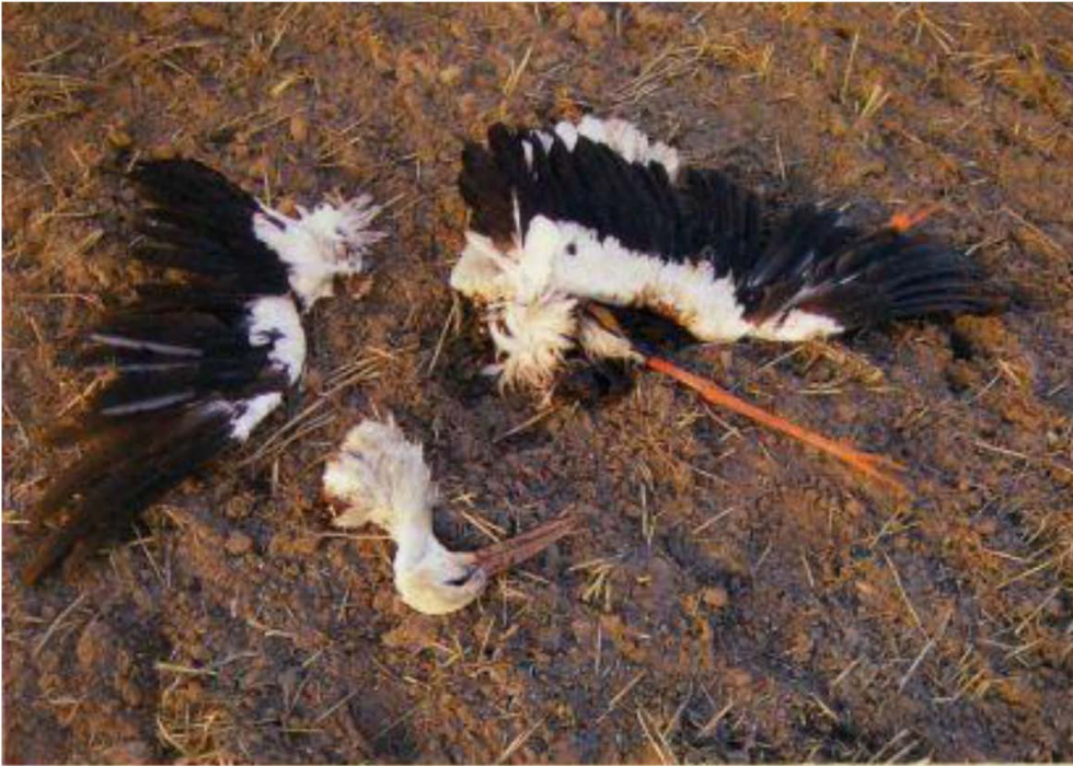
Bild 3: Echte „Schlagopfer“ weisen häufig schwere Frakturen oder gar eine Zerteilung des Rumpfes auf, wie hier bei einem Weißstorch, dessen Einzelteile am Fundort zusammengesucht wurden.

herangerast und wieder und wieder eines. Das ist der sprichwörtliche Kampf gegen Windmühlenflügel, den jeder Vogel und jede Fledermaus verliert.