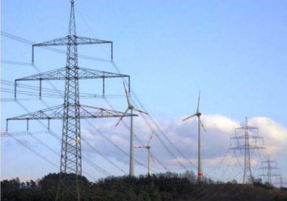
Bild 9. Mit neuer Technik sollen 380 KV-Leitungen doppelt so viel Strom transportieren und sich dabei auf bis zu 210 °C erhitzen. Das wären dann elektrische Heizdrähte quer durch Deutschland. Und was ist mit den Vögeln, die sich auf die heißen Drähte setzen?

und der Bau würde viele Jahre dauern. Aber man könnte die vorhandenen Fernleitungen so umbauen, dass sie doppelt so viel Strom leiten können. Das geht mit den derzeitigen Leiterseilen („Stromdrähten“) deshalb nicht, weil sie sich erwärmen und ausdehnen. Sie hängen durch und zwar umso tiefer, je mehr Strom durch geleitet wird und spätestens bei 80 °C ist Schluss.