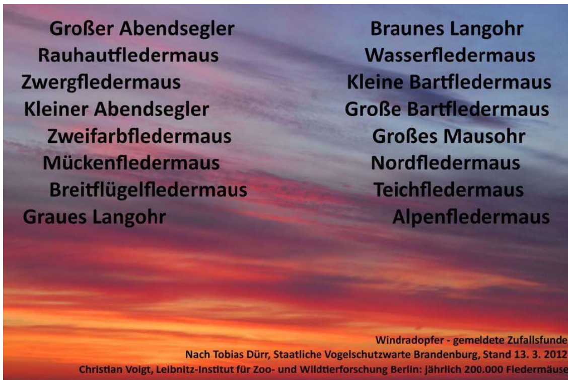
Bild 7: Fast alle Arten von Fledermäusen werden Opfer von Windrädern, darunter viele ziehende Fledermäuse aus Ost-Europa