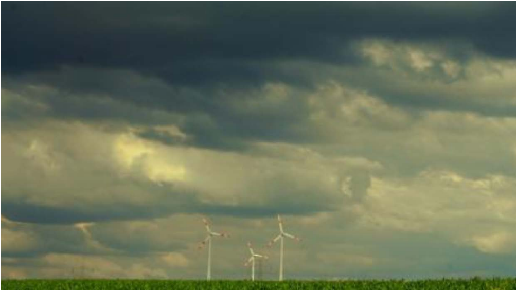
Bild 1: Die friedliche Idylle täuscht. Windräder töten Vögel und Fledermäuse, gefährden Spaziergänger und machen krank. Sie ruinieren unsere Kulturlandschaft, entwerten Grund und Boden, verteuern den Strom und bringen friedliche Bürger gegeneinander auf. Sie sind Symbole des Versagens der Naturschutzverbände und der Politik.