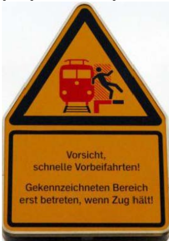
Bild 2: Schild warnt vor den Turbulenzen und dem Sog der Züge begegnenden LKWs oder von vorbei fahrenden Zügen sind lebensgefährlich. Ein Hobbyfilmer wollte einen dramatischen Streifen drehen, stellte seine Kamera ganz dicht an die Bahngleise und filmte den herannahenden Zug. Er glaubte sich sicher, doch der Sog des Unterdruckes zog ihn an den Zug, er überlebte, seine Kamera nicht.

Die Sogwirkung der Rotorblätter zeigt ein einfacher Versuch. Hält man zwei Blatt Papier in geringem parallelen Abstand vor den Mund und bläst hindurch, so weichen sie nicht etwa auseinander, wie man vermuten könnte, sondern der Sog zieht sie aufeinander zu. Ersetzt man eines der beiden Blätter durch starren Karton, zieht der Sog das leicht bewegliche Papier auf den Karton. Der Karton entspricht dem starren Rotorblatt und das bewegliche Papier dem Vogel oder der Fledermaus. Jedoch pustet kein Mensch, sondern ein Tornado mit Windgeschwindigkeiten bis über 400 km/h. Ein solcher Sog ist tödlich, da gibt es kein Entkommen. Schon viel geringere Geschwindigkeiten wie bei Schiffsschrauben oder sich eng