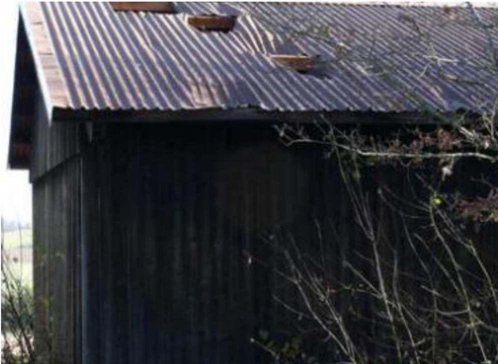
Bild 10: Eisgeschosse von einem 130 Meter entfernten Windrad haben drei Löcher in das Blechdach geschlagen. Ein Schädeldach wurde zum Glück nicht getroffen

Wetter um null Grad, aber auch bei Temperaturen über Null. Nach und nach werden die Eiskrusten dicker und schwerer. Zugleich zerran Fliehkräfte an ihnen und irgendwann lösen sie sich und schießen als Eisplatten wie Geschosse mit bis zu 400 km/h davon. Ihre Reichweite hängt von der jeweiligen Stellung des Rotorblattes und seiner Radialgeschwindigkeit zum Zeitpunkt der Ablösung ab. Deshalb können die Eisgeschosse unmittelbar am Turm einschlagen. Sie können aber auch an jedem anderen Punkt in einem Umkreis von einigen hundert Metern um das Windrad herum einschlagen, wobei der Wind sie zusätzlich ablenkt. Der TÜV Nord kommt in einer Untersuchung auf 600 m Reichweite. Und so können die Folgen aussehen: