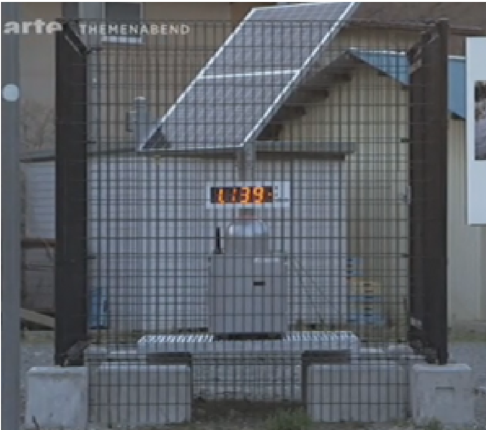
Bild 1: Dosimeter in einer japanischen Geisterstadt die wegen der Reaktorkatastrophe von Fukushima aufgegeben werden musste (Ausschnitt aus "Die Welt nach Fukushima").

Schlimm ist das Schicksal derer, die am Rande der verseuchten Zone leben. In einem nicht genannten Dorf am Rand der Berge, liegt die Strahlung bei 0,338 \mu\text{Sv/h} . Das Dorf wurde nicht evakuiert. Die besorgte Leiterin einer Kindertagesstätte berichtet, sie würden täglich diskutieren wie sie mit der Strahlung umgingen. Sie hätten sich geeinigt, die Kinder eine halbe Stunde am Tag nach draußen zu lassen. Besonders hilflos wirkt die Aufstellung wassergefüllter Flaschen als Strahlenschutz.