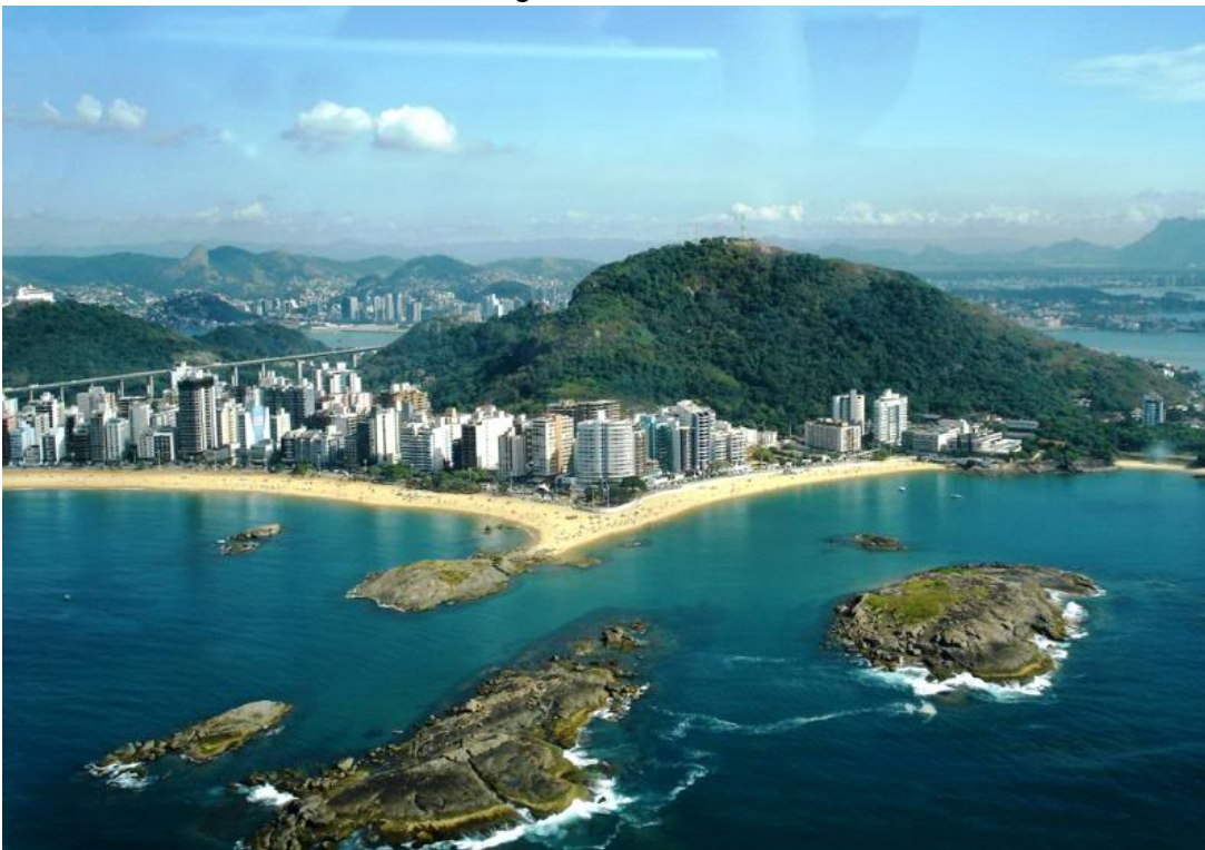
Bild 3: Guarapari, bald eine Geisterstadt. Die brasilianische Regierung

Bild 2: Todeszone Guarapari. Die Strahlung in dieser Stadt ist 17 mal so hoch wie in den evakuierten Ortschaften der Präfektur Fukushima. Jetzt, da die hohen Strahlenwerte bekannt sind, haben wir die brasilianische Regierung sofort informiert. Bestimmt ordnete die brasilianische Regierung so bald wie möglich die Evakuierung der Stadt an. Zwar hat die 1679 gegründete Stadt im Vergleich zum Rest Brasiliens keine erhöhten Raten von Krebs, Geburtsdefekten oder anderen Erkrankungen, aber das lässt sich nur mit der bisherigen Unwissenheit über die Höhe der Strahlung erklären.