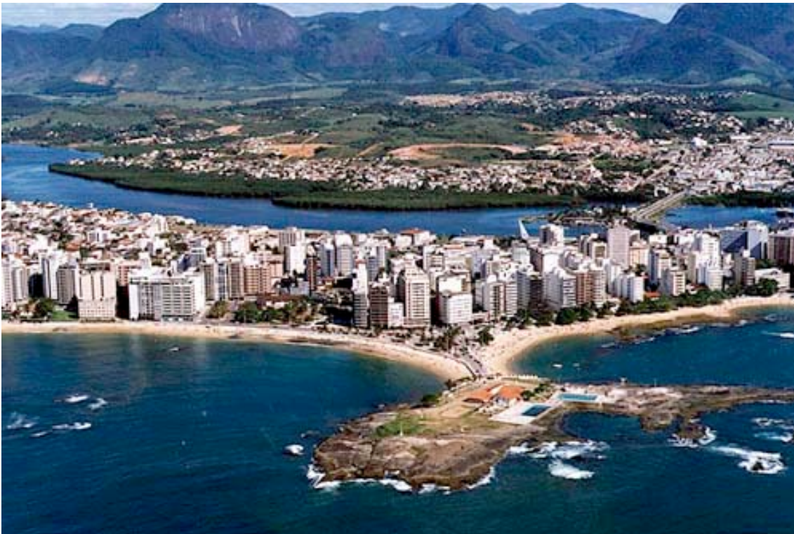
Bild 2: Todeszone Guarapari. Die Strahlung in dieser Stadt ist 17 mal so hoch wie in den evakuierten Ortschaften der Präfektur Fukushima. Jetzt, da die hohen Strahlenwerte bekannt sind, haben wir die brasilianische Regierung sofort informiert. Bestimmt ordnete die brasilianische Regierung so bald wie möglich die Evakuierung der Stadt an. Zwar hat die 1679 gegründete Stadt im Vergleich zum Rest Brasiliens keine erhöhten Raten von Krebs, Geburtsdefekten oder anderen Erkrankungen, aber das lässt sich nur mit der bisherigen Unwissenheit über die Höhe der Strahlung erklären.