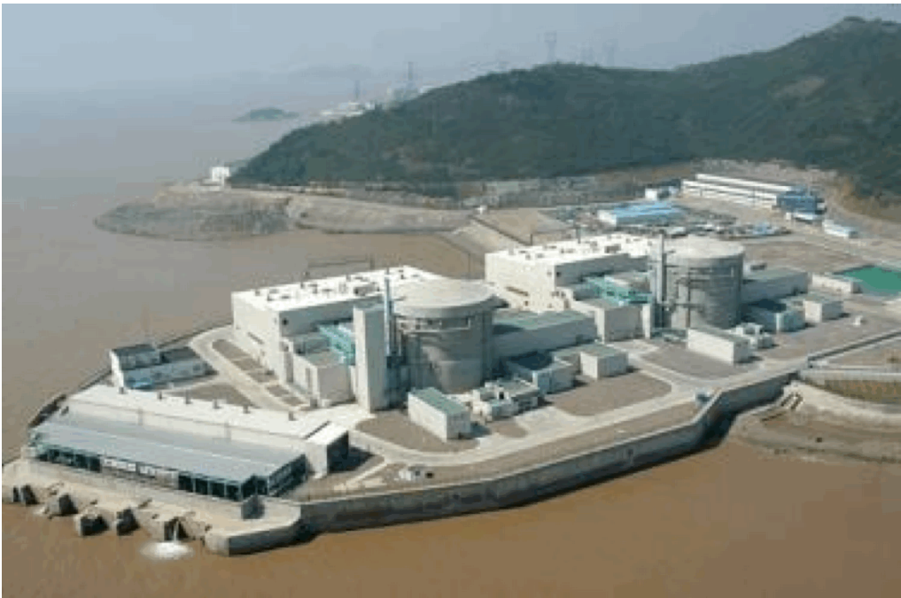
Photo AECL CANDU China