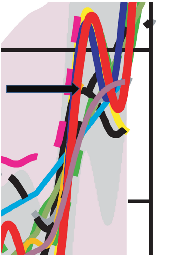
Abbildung 2: Details aus Mann et al. (EOS 2003) aus Abbildung 1. Der Pfeil deutet auf die Stelle, wo die Kurve von Briffa zum Vorschein kommt.

Tatsächlich haben sie nicht einfach „den Rückgang versteckt“, sondern ihr „hide the decline“ war schlimmer als wir gedacht hatten. Mann et al. haben Daten nach 1960 nicht einfach gelöscht, sie haben Daten seit 1940 gelöscht. Man erkennt, dass der letzte Punkt der Briffa-Rekonstruktion (um 1940) hinter den Spaghetti in der folgenden Graphik zum Vorschein kommt: