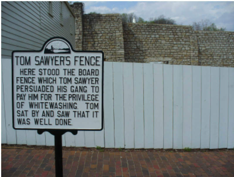
Tom Sawyers Zaun – das berühmteste „whitewashing“ der Literatur

Der Inhalt des Berichts ( ☞ Quelle ) umfaßt nur fünf Seiten und geht mit den ClimateGate-Beschuldigten der Climatic Research Unit (CRU) erwartungsgemäß sehr freundlich um, kritisiert aber deren amateurhafte und unorganisierte Arbeitsweise.