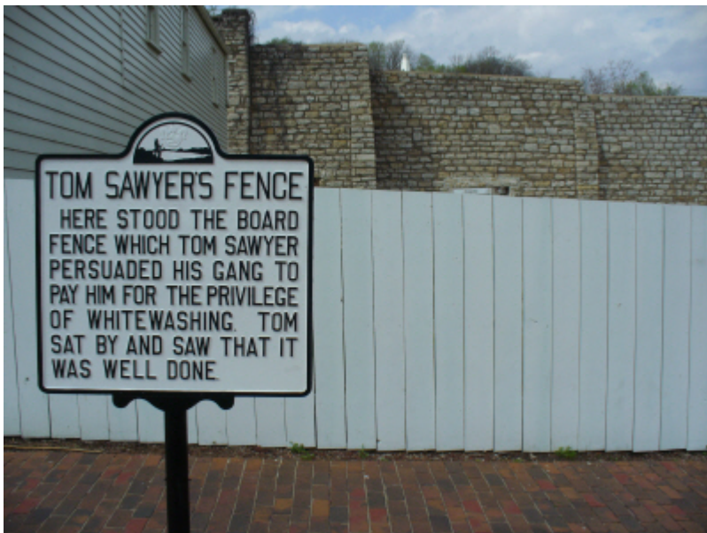
Tom Sawyers Zaun – das berühmteste „whitewashing“ der Literatur

Der Inhalt des Berichts ( ☞ Quelle ) umfaßt nur fünf Seiten und geht mit den ClimateGate-Beschuldigten der Climatic Research Unit (CRU) erwartungsgemäß sehr freundlich um, kritisiert aber deren amateurhafte und unorganisierte Arbeitsweise.